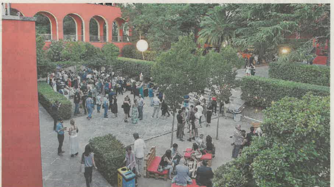
Los jardines del Parc Audiovisual se llenaron de profesionales del mundo del cine.