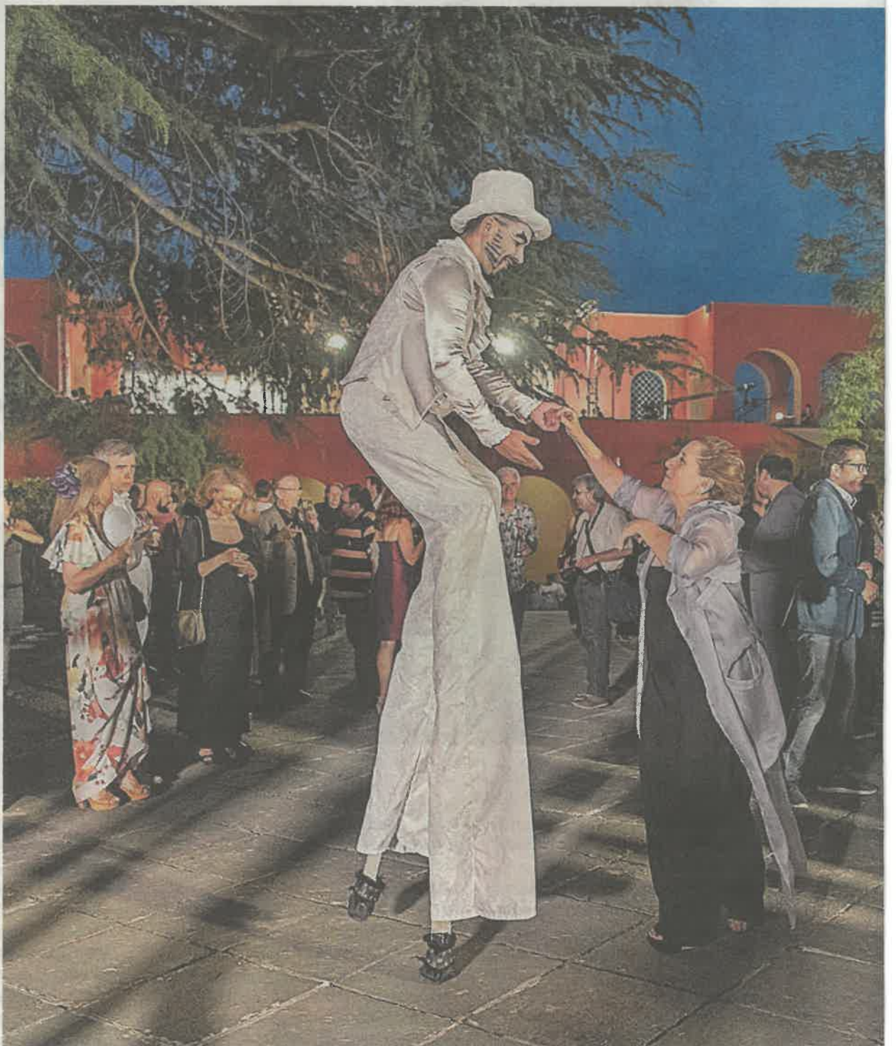
La velada tuvo un tono lúdico y distendido.