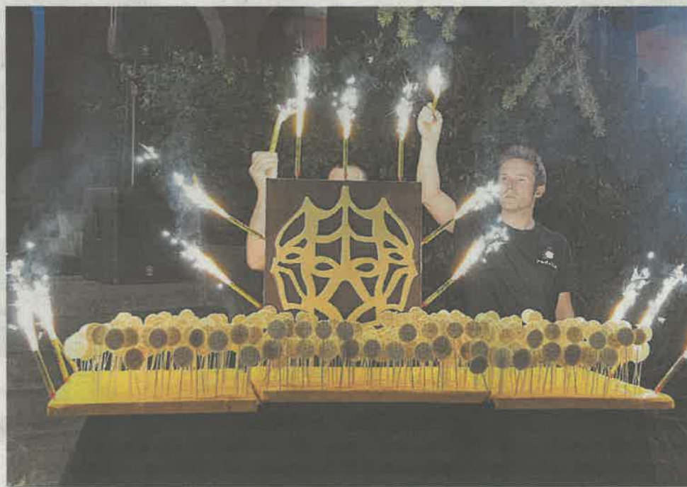
Los invitados disfrutaron de una amplia oferta gastronómica.