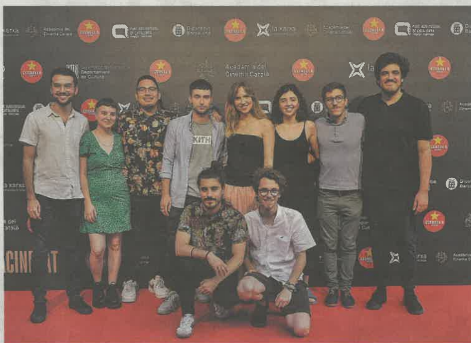
No faltó la tradicional "alfombra roja".